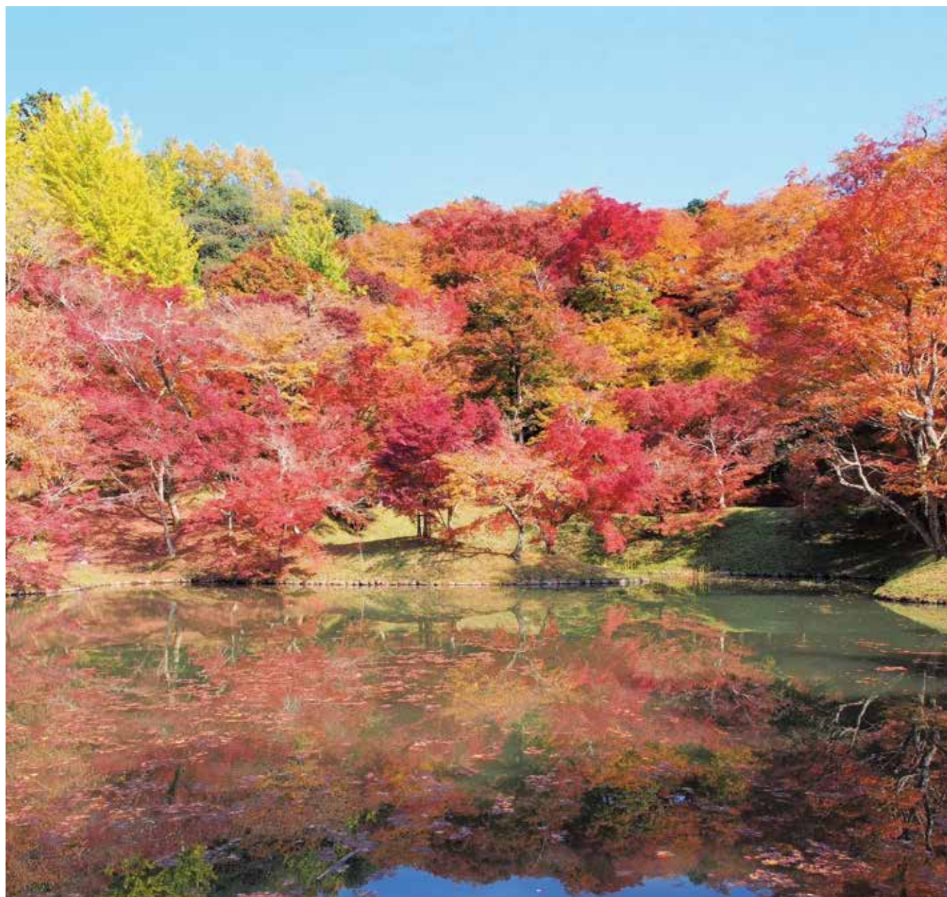
用作公園（ゆうじゃくこうえん）の紅葉