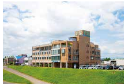
オアシス第二病院

オアシス第一病院は45床の一般病棟と60床の特殊疾患病棟、オアシス第二病院は100床の特殊疾患病棟を有する医療機関です。地域の皆様のかかりつけ医療機関として、患者様とご家族様に寄り添った医療の提供を目指しています。特殊疾患病棟においては、神経内科専門医が4名おり、神経難病等の患者様の長期療養を専門的に行っております。人工呼吸器管理が必要な患者様もお受け入れが可能です。