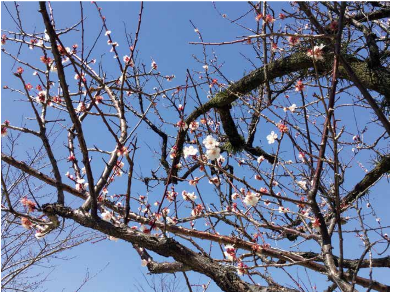
春の訪れ～コロナ禍を乗り越えて