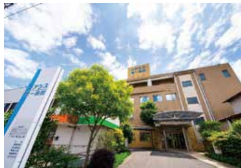
オアシス第一病院