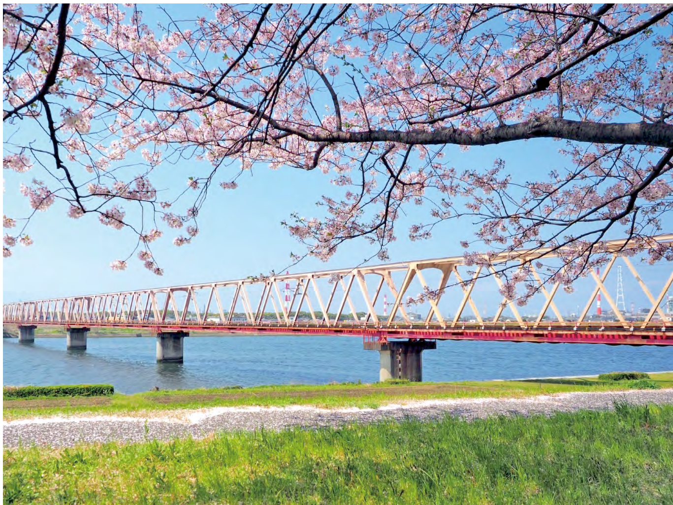
大野川（大分市大在）