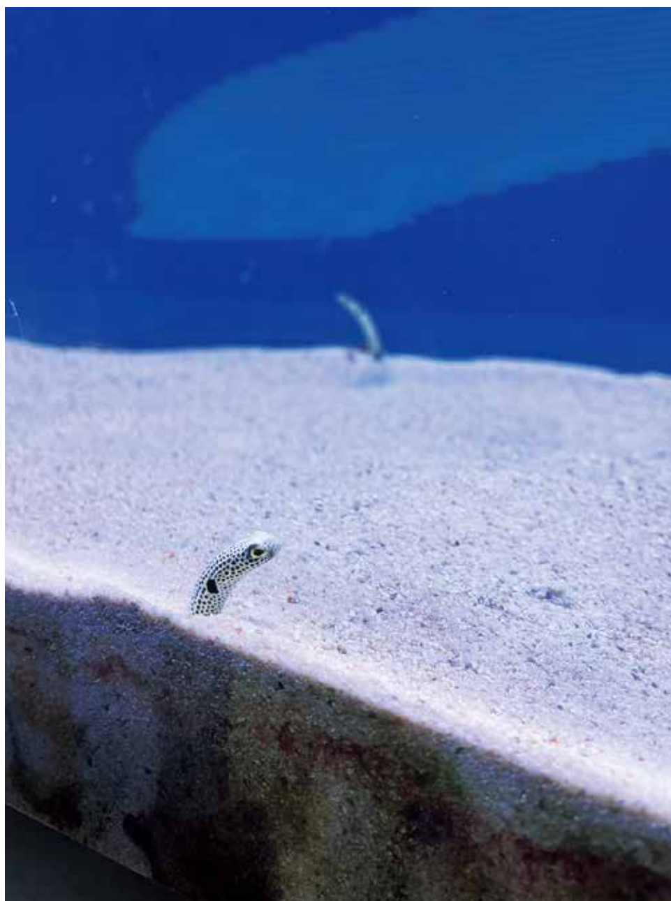
美ら海水族館（沖縄県）