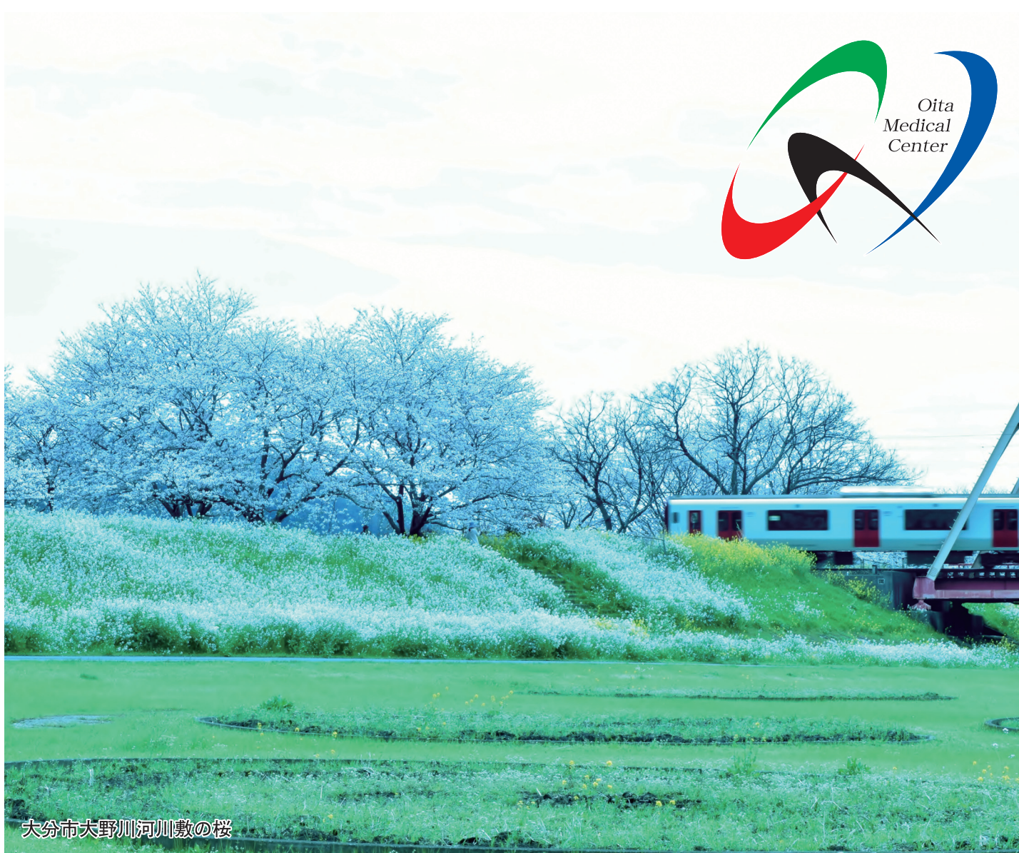
大分市大野川河川敷の桜